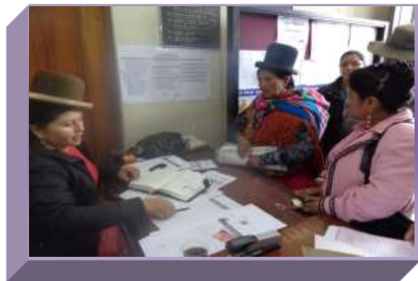
RECEPCION DE DENUNCIAS