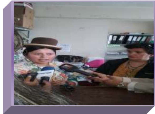
JUZGADOS DE "YANACOCHA"