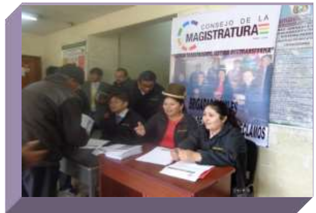
JUZGADOS DE LA CIUDAD DE "EL ALTO"

En los juzgados de la ciudad de El Alto, se recepción 80 denuncias