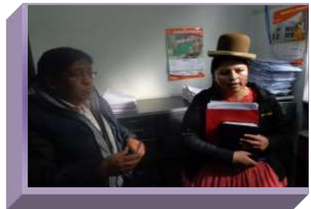
JUZGADOS DE "EL ALTO"