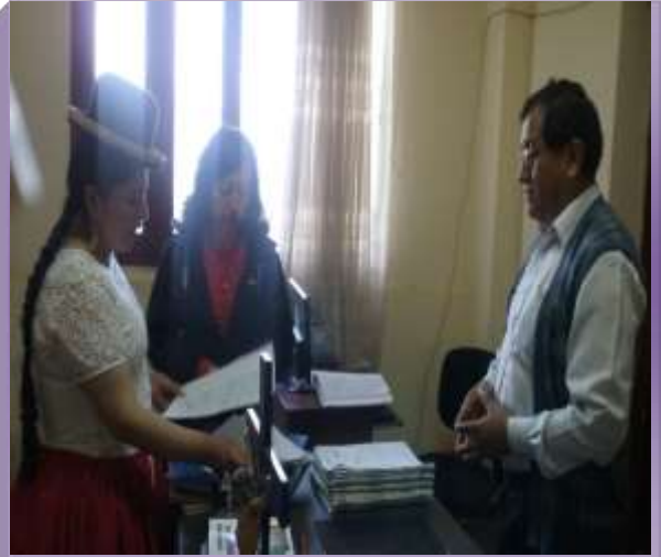
JUZGADO DE PARTIDO Y SENTENCIA MIXTO DE "COROICO"