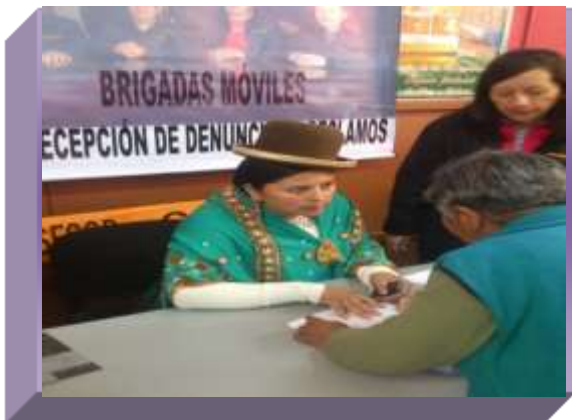
JUZGADOS DEL EDIFICIO "ARCO IRIS"