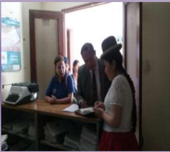
JUZGADO DE INSTRUCCIÓN MIXTO DE "COROICO"