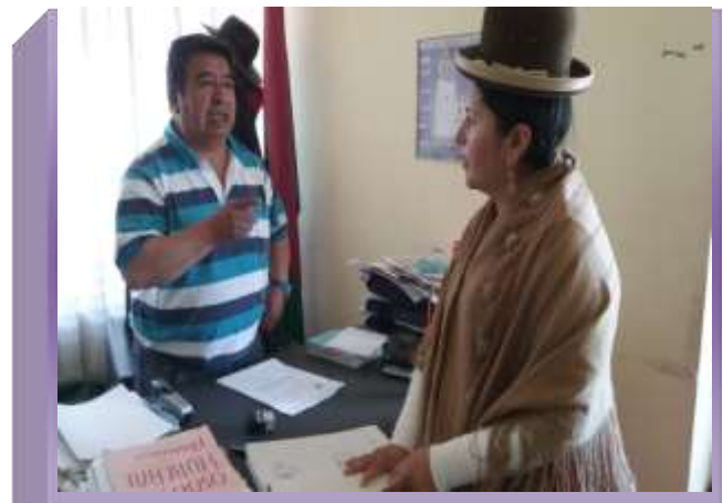
JUEZ DE INSTRUCCIÓN MIXTO DE "GUAQUI"