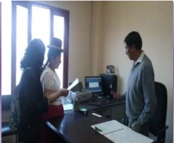
DERECHOS REALES "COROICO"