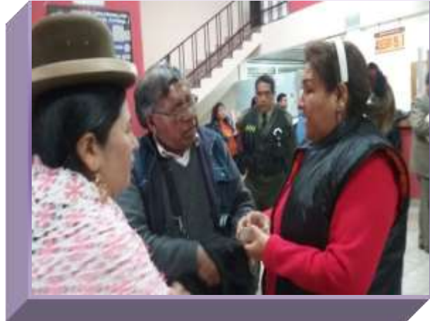
DEPENDENCIAS DE "DERECHOS REALES"