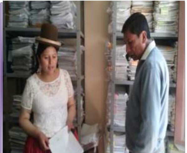
DERECHOS REALES "COROICO"