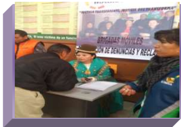
DERECHOS REALES "LA PAZ"