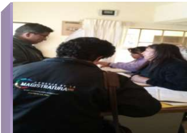
JUZGADOS DE INSTRUCCIÓN MIXTO DE "GUAQUI"